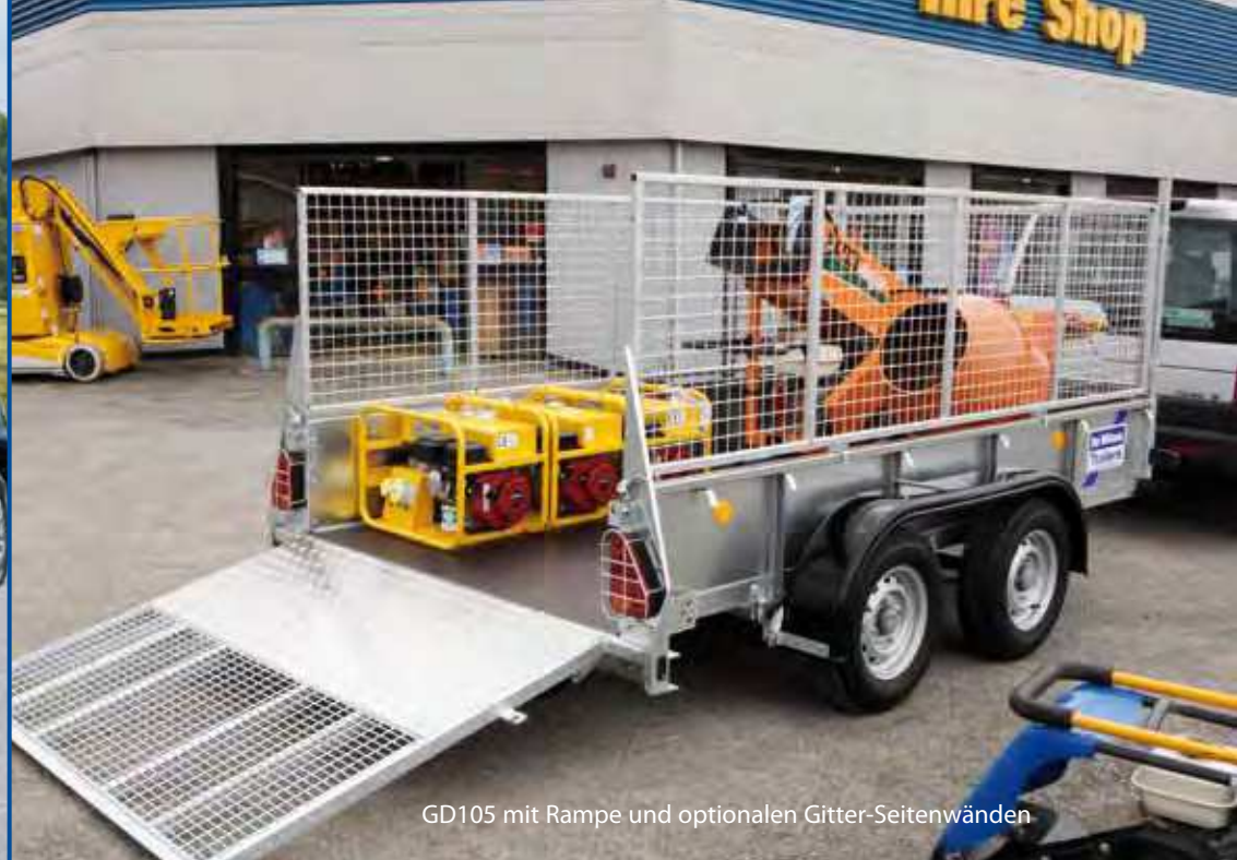
GD105 mit Rampe und optionalen Gitter-Seitenwänden