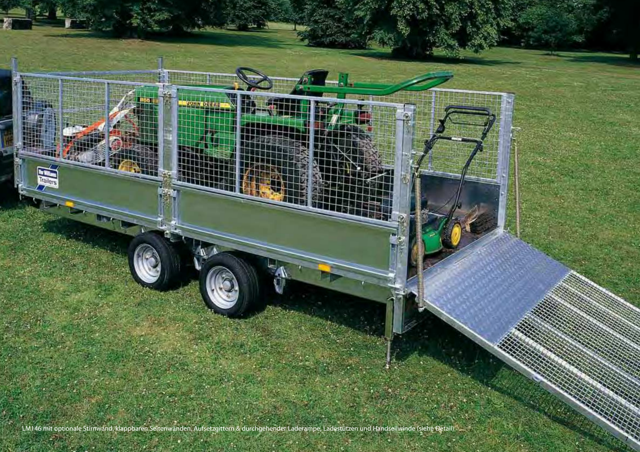
LM146 mit optionale Stirnwand, klappbaren Seitenwänden, Aufsetzgittern & durchgehender Laderampe, Ladestützen und Handseilwinde (siehe Detail)