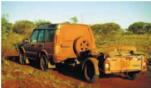
Ein GD64 bei der Arbeit im australischen Outback

Unsere Allzweckanhänger sind in fast jeder Umgebung zuhause, mit nahezu jeder Art von Ladung, von Baumaterialien bis hin zu Expeditionsausrüstungen.