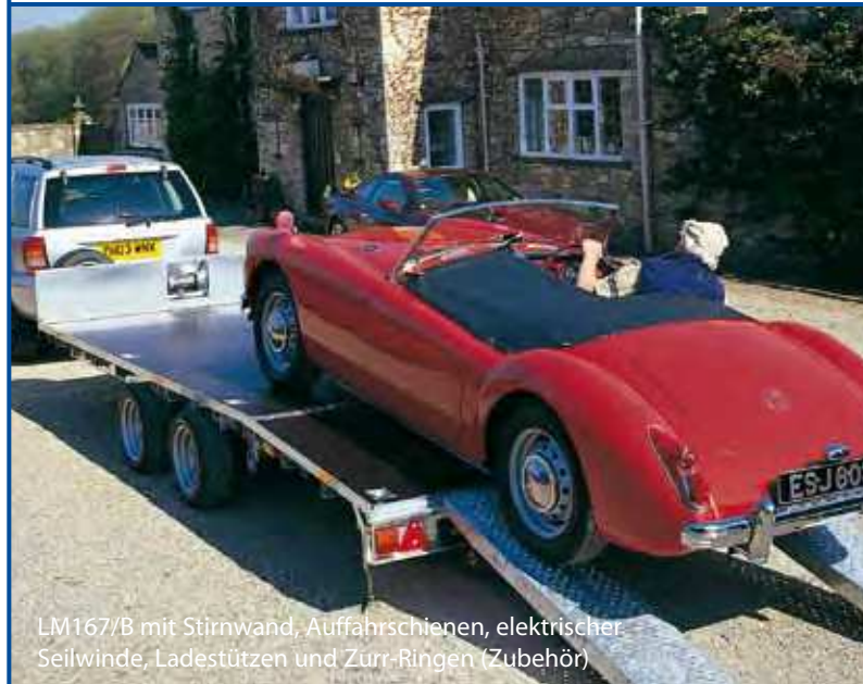
LM167/B mit Stirnwand, Auffahrschienen, elektrischer Seilwinde, Ladestützen und Zurr-Ringen (Zubehör)