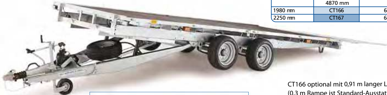
CT166 optional mit 0,91 m langer Laderampe (0,3 m Rampe ist Standard-Ausstattung)