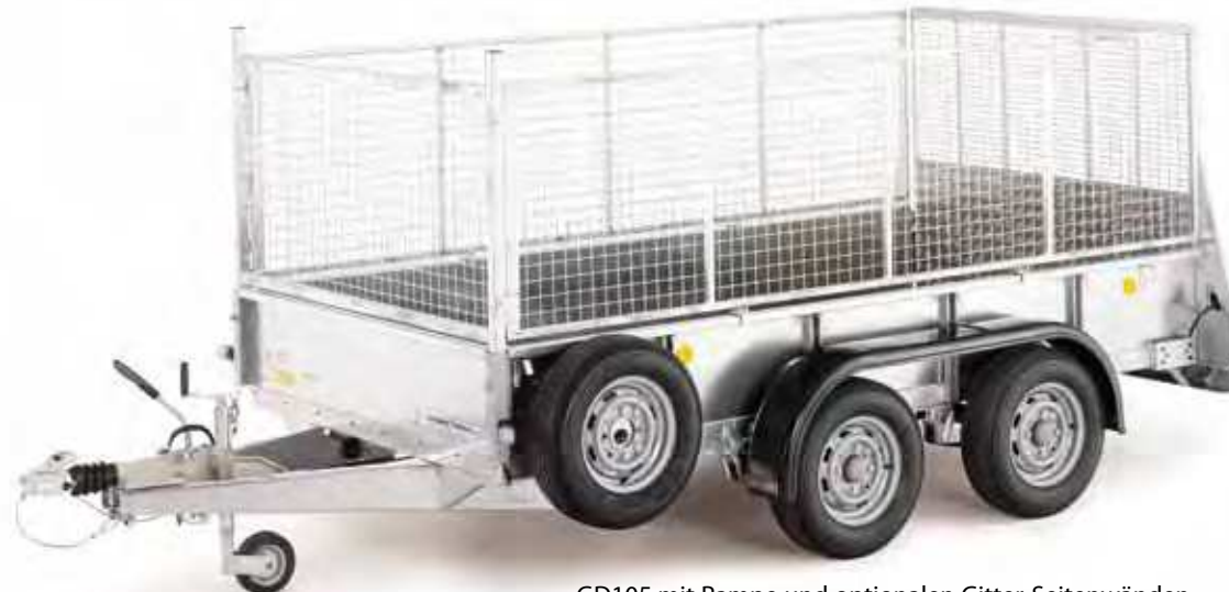
GD105 mit Rampe und optionalen Gitter-Seitenwänden