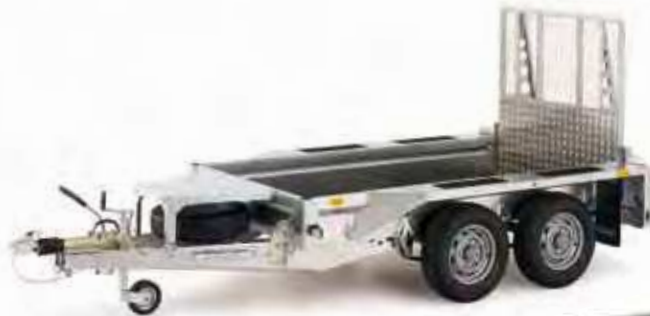
GX84 mit Rampe