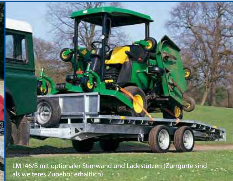
LM146/B mit optionaler Stirnwand und Ladestützen (Zurrgurte sind als weiteres Zubehör erhältlich)