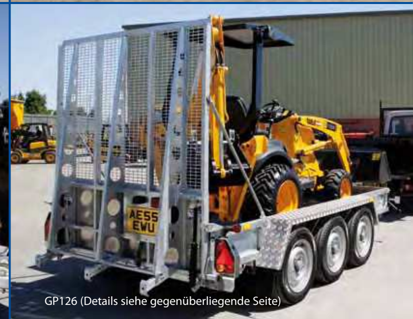
GP126 (Details siehe gegenüberliegende Seite)