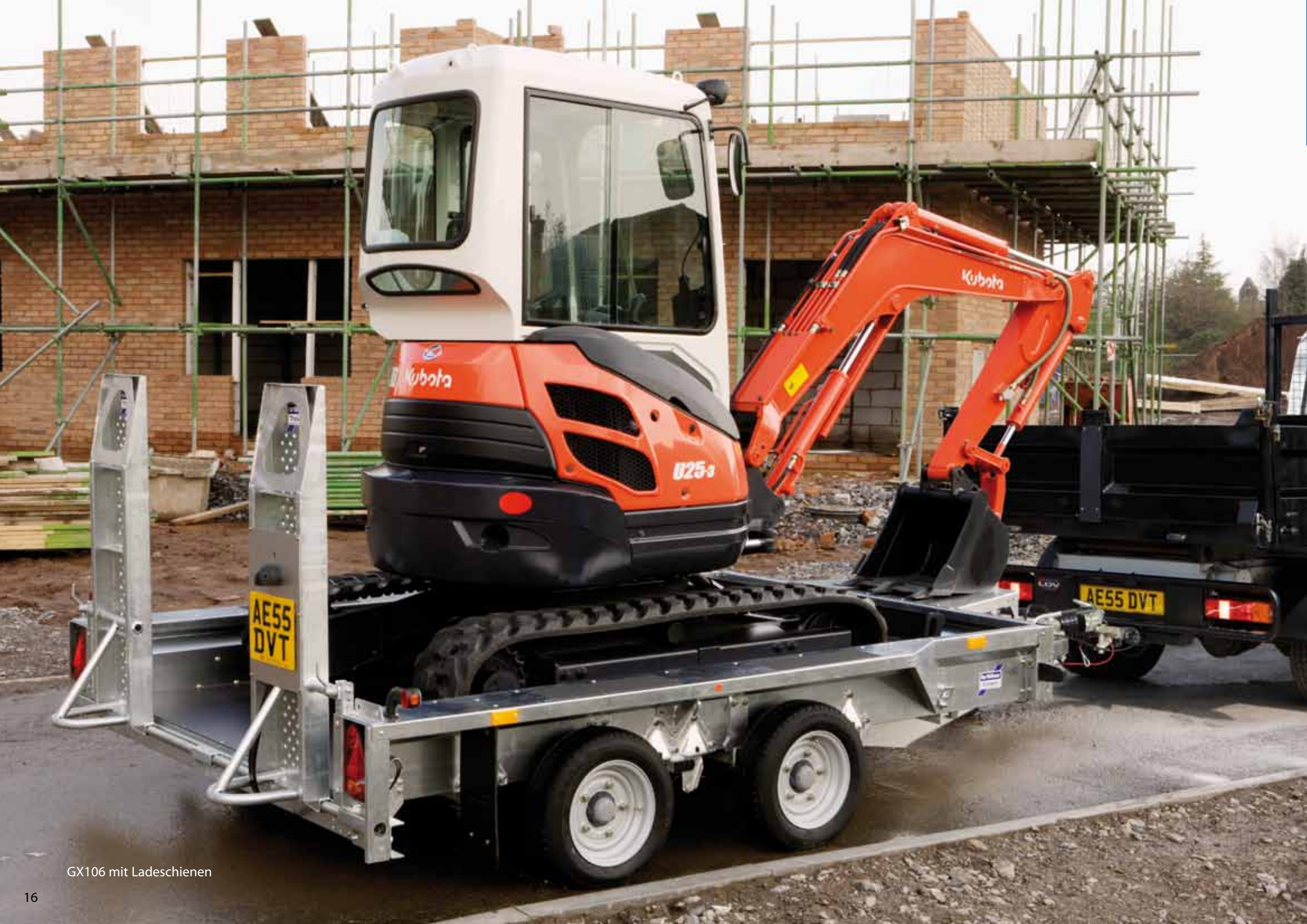
GX106 mit Ladeschienen