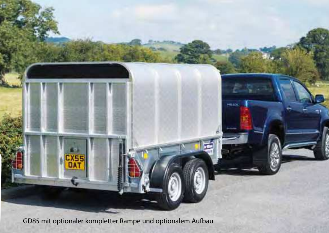
GD85 mit optionaler kompletter Rampe und optionalem Aufbau