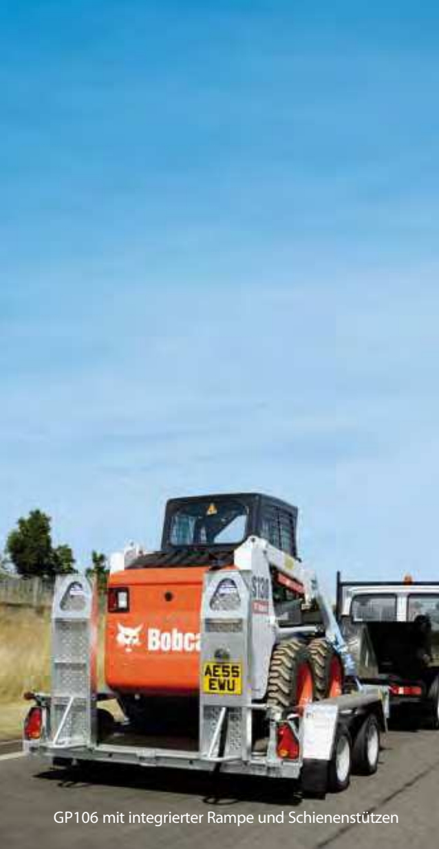
GP106 mit integrierter Rampe und Schienenstützen

Produktentwurf, Beschreibungen, Farben, Spezifikationen usw. sind korrekt bei Druckfreigabe. Wir streben fortwährend danach, unsere Produkte zu verbessern. Von Zeit zu Zeit mag dies in Änderungen in unserem Angebot oder bei einzelnen Modellen münden. Bitte überprüfen Sie ob Entwurf, Beschreibung, Farben, Spezifikationen wie beschrieben in dieser Broschüre zum Bestellungszeitpunkt noch gültig sind.