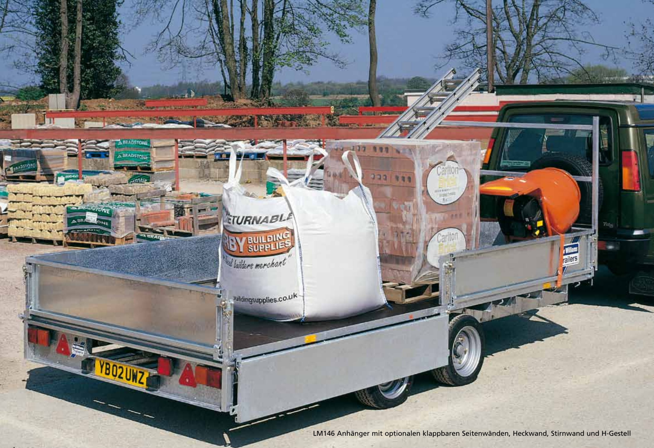
LM146 Anhänger mit optionalen klappbaren Seitenwänden, Heckwand, Stirnwand und H-Gestell