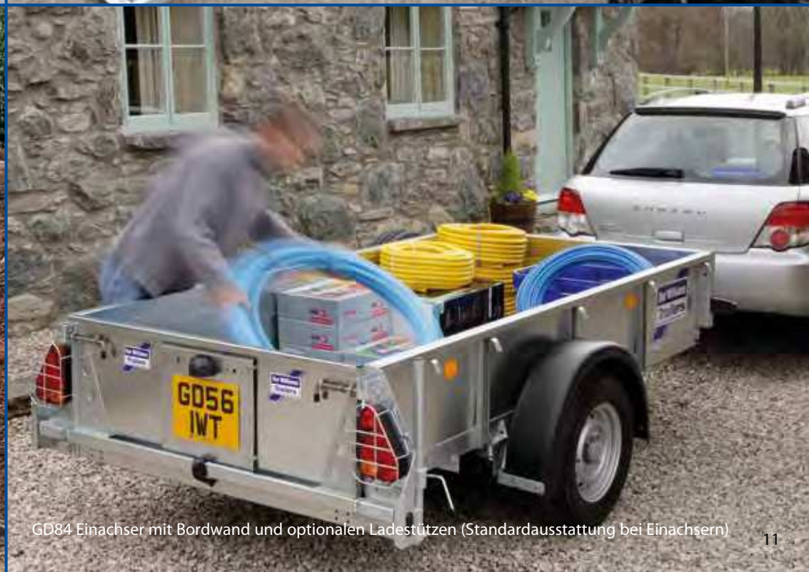
GD84 Einachser mit Bordwand und optionalen Ladestützen (Standardausstattung bei Einachsern)