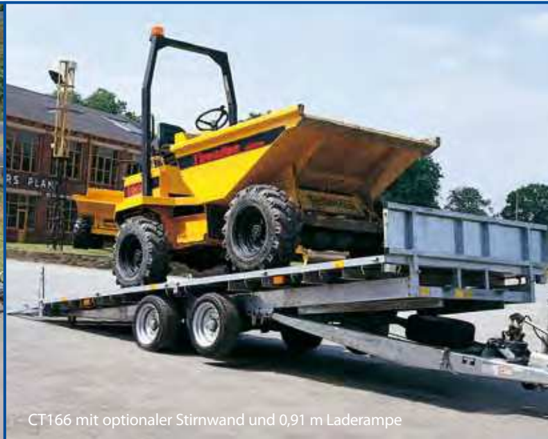
CT166 mit optionaler Stirnwand und 0,91 m Laderampe

Der Kippanhänger ist die ideale Wahl für Besitzer von Fahrzeugen mit niedrigem Bodenabstand oder für Abschleppdienste. Er bietet alle Vorteile der Hochlader-Modelle, kombiniert mit einer leicht zu kippenden Ladefläche für bequemes Verladen.