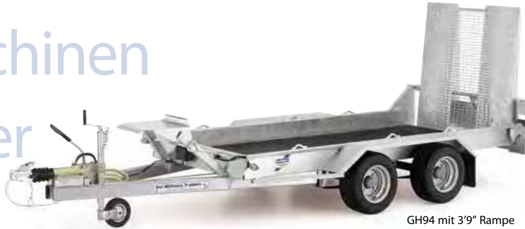
GH94 mit 3'9" Rampe