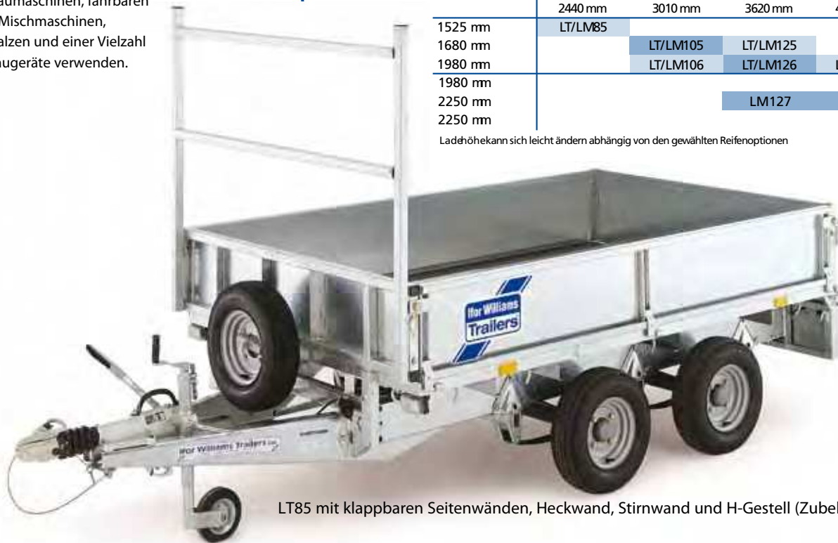
LT85 mit klappbaren Seitenwänden, Heckwand, Stirnwand und H-Gestell (Zubehör)

Ladehöhe kann sich leicht ändern abhängig von den gewählten Reifenoptionen