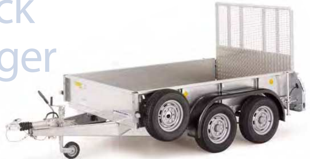
GD85 mit Rampe