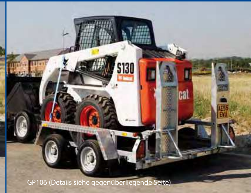
GP106 (Details siehe gegenüberliegende Seite)