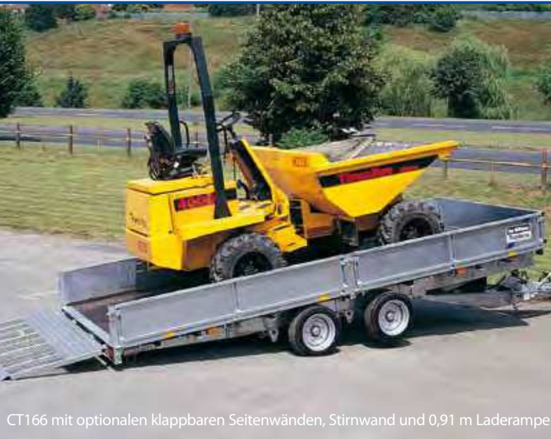
CT166 mit optionalen klappbaren Seitenwänden, Stirnwand und 0,91 m Laderampe