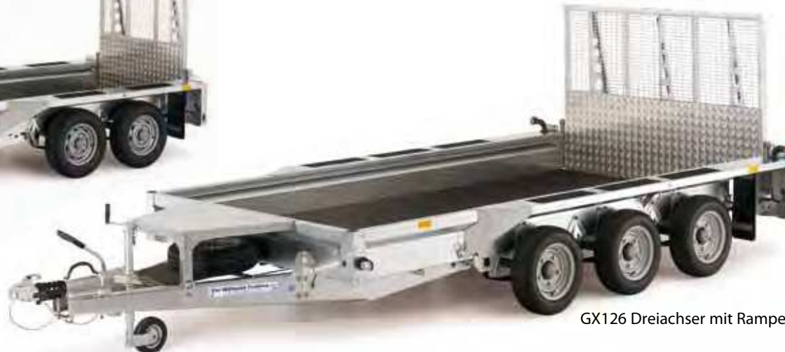
GX126 Dreiachser mit Rampe