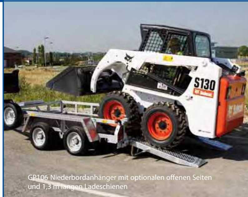
GP106 Niederbordanhänger mit optionalen offenen Seiten und 1,3 m langen Ladeschienen

Hochbordmodelle sind mit eingelassenen Seiten und einem optionalen Auflagebock für Baggerarme ausgestattet. Diese Option ist ideal für die flexible Nutzung des Anhängers; gewöhnlicherweise mit höheren, sichereren Seitenwänden als die Allzweck-Anhänger.