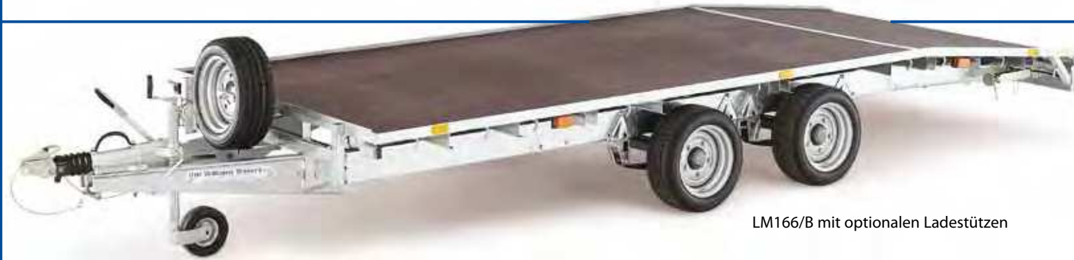
LM166/B mit optionalen Ladestützen

Fahrzeuge mit niedrigem Bodenabstand sind unter Umständen für das Verladen auf diese Art von Anhänger nicht geeignet.