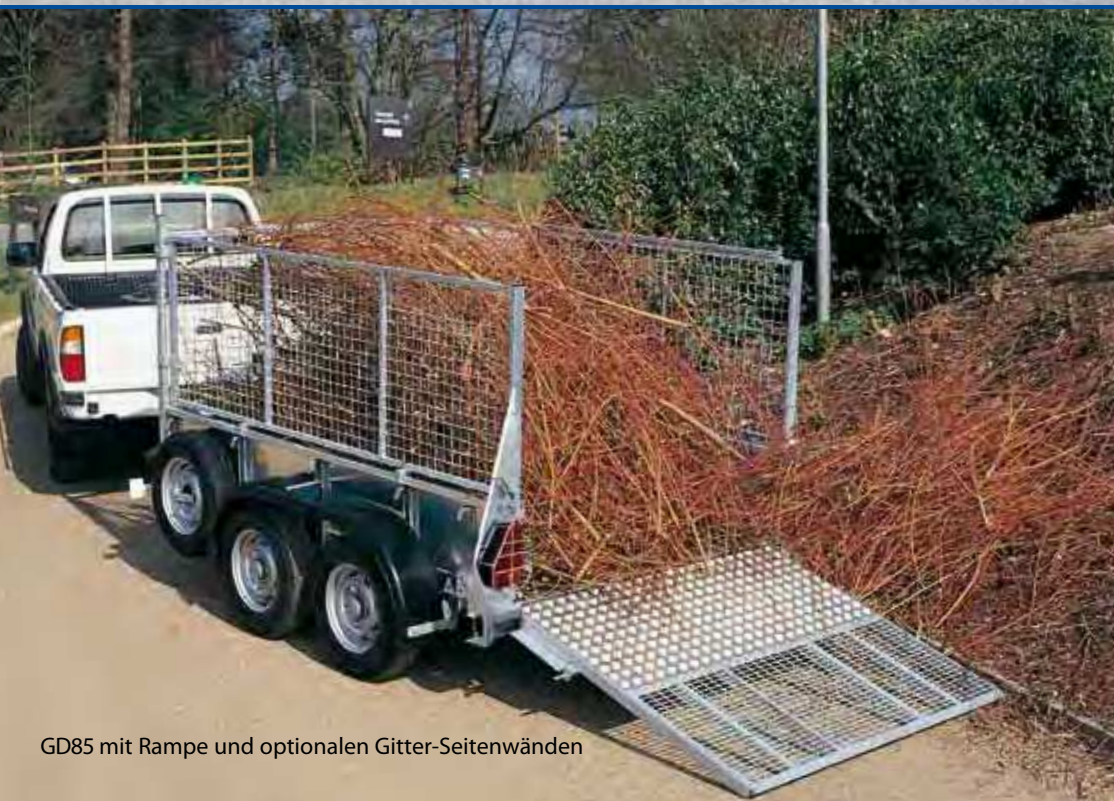
GD85 mit Rampe und optionalen Gitter-Seitenwänden