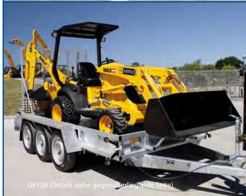
GP126 (Details siehe gegenüberliegende Seite)