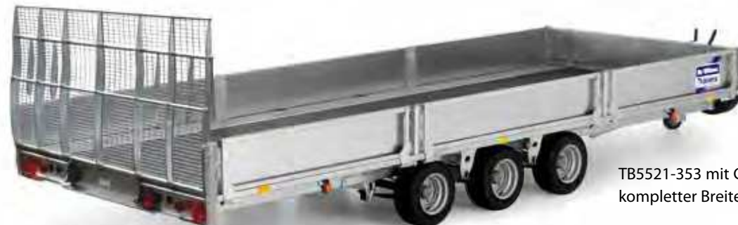
TB5521-353 mit Gitternetz-Rampe auf kompletter Breite und Seitenwänden

Zusätzlich zu den Modellen CT166 & CT167 bieten wir 6 weitere Kipp-Anhängermodelle an. 4 verschiedene Längen, 2 davon als Dreilachser, alle mit einer grosszügigen Breite von 2.100mm. Ideal für Bagger und weitere Baumaschinen. Für Details fragen Sie bitte Ihren Händler oder konsultieren unsere spezielle Kipp-Anhänger Broschüre.